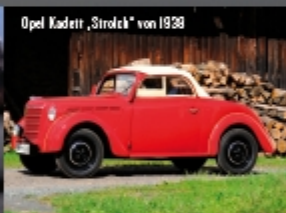
Opel Kadett „Stroch“ von 1938