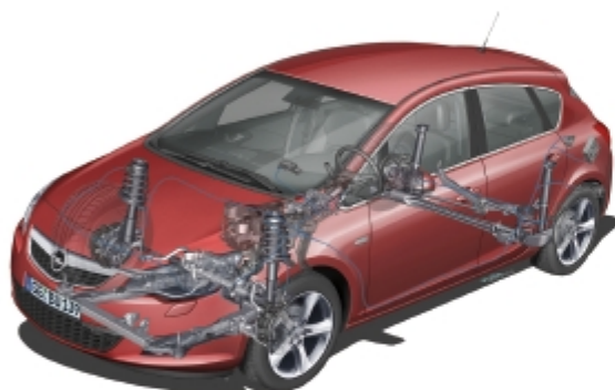
Der neue Opel Astra

Präsentiert von: Internationales Technisches Entwicklungszentrum der Adam Opel GmbH, Gesellschaft zur Förderung des Ingenieurstudiums, Hochschule RheinMain