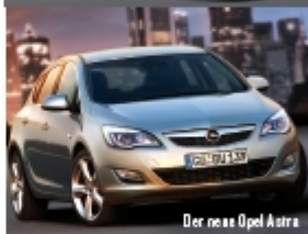
Der neue Opel Astra