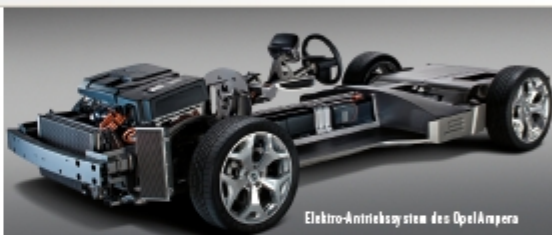
Elektro-Antriebssystem des Opel Ampera