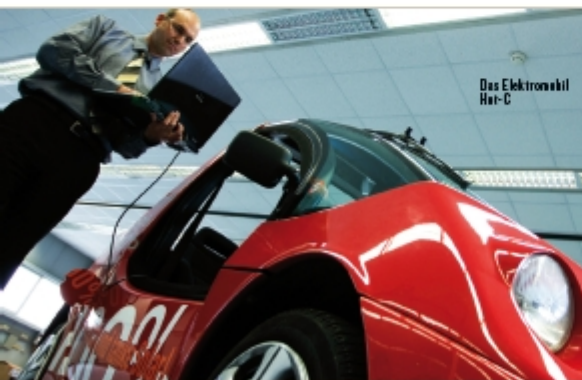
Das Elektromobil Hot-C